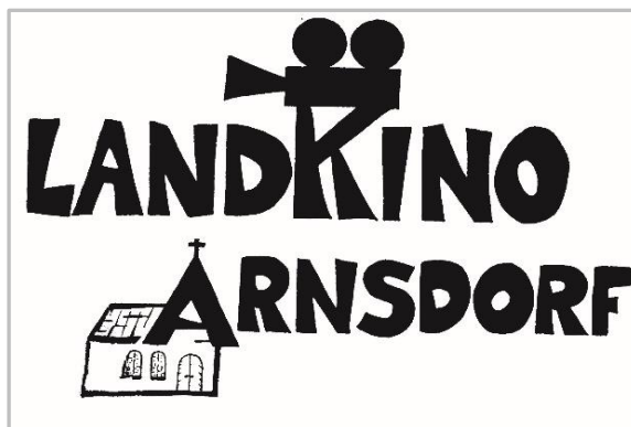
Logo des Landkino Arnsdorf

Letztendlich ist es die Dorfgemeinschaft, die einen lebendigen Begegnungsort geschaffen hat und mit weltanschaulicher Offenheit und großen ehrenamtlichem Engagement diesen Treffpunkt möglich macht.