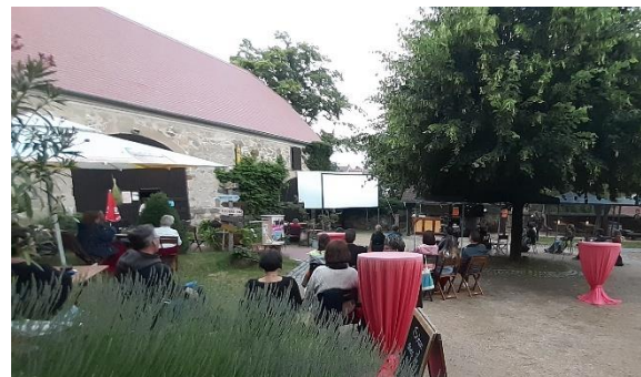
Landkino Arnsdorf nach der Dachsanierung

„Als Fan der Kinoscheune kann ich nun selbstständig mit meinem Rolli in den Kinosaal gelangen.“