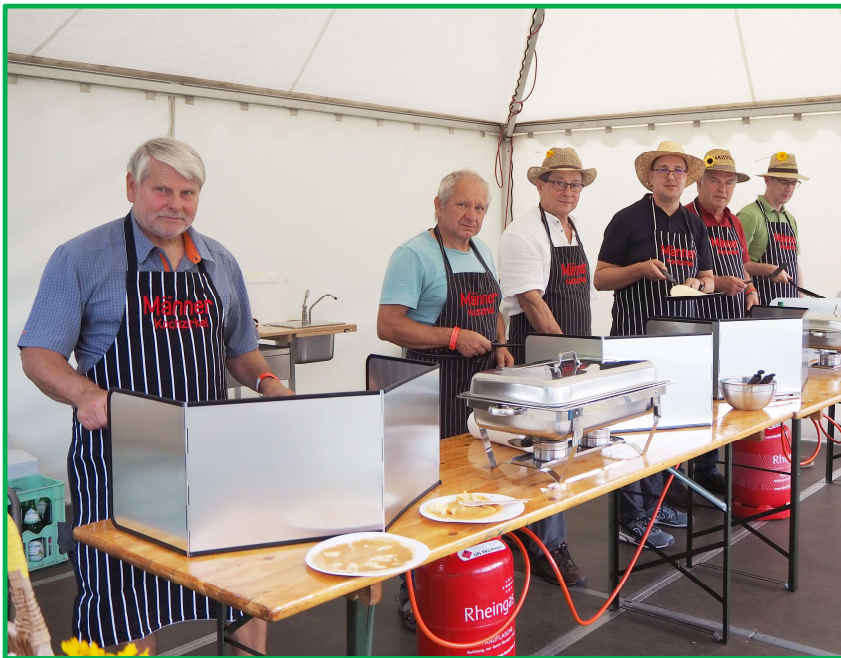
29. Deutscher Präventionstag im Spreeauenpark Wir backen 750 Plinsen in 5 Stunden