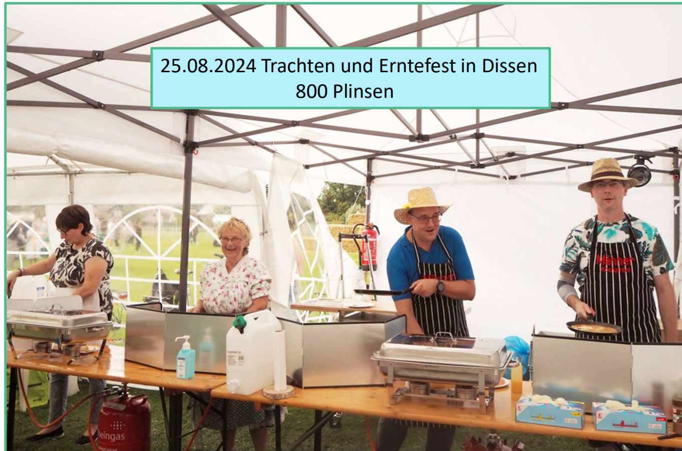
25.08.2024 Trachten und Erntefest in Dissen 800 Plinsen