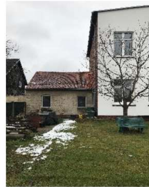
Istzustand 2024 nach der Baumaßnahme