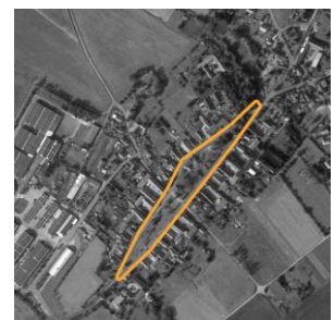
Abb. 2: Lageplan

Der Anger prägt - bezeichnenderweise - den Charakter des Straßenangerdorfes Peritz. Neben der kulturhistorischen ist auch die siedlungsökologische Bedeutung dieses grünen Bandes groß. Mit dem Projekt sollten diese Funktionen wieder aufgewertet und die Lebensqualität im Dorf verbessert werden. Mit Anlieger-Workshops und Pflanzaktionen wurden die Bürger intensiv einbezogen.