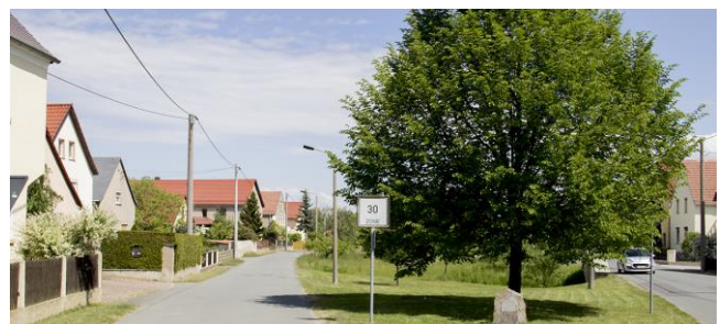
Abb. 3: Dorflinde

Am Bach wurden in einigen Bereichen naturnahe Uferböschungen wiederhergestellt, an anderen Stellen die Betongitterplatten zur Böschungsbefestigung belassen. Die Dorfstraße und zwei Fußwege queren den Bach mit Brücken, Durchlassbauwerke dienen der Regulierung des Baches im Hochwasserfall. An mehreren Stellen führen Natursteintreppen hinab zum Gewässer. Am neuen Spielplatz wurde ein flacher Gewässerzugang eingerichtet.