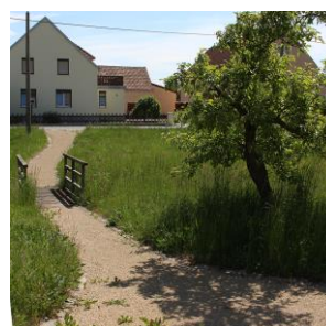
Abb. 4: Querende Wege, unversiegelt