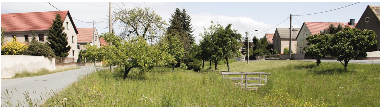
Abb. 1: Blick von Süden