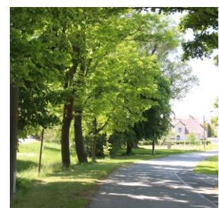
Abb. 5: Dorfstraße und Auencharakter