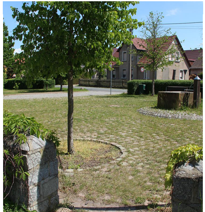
Abb. 6: Rasenpflaster am Dorfplatz

extensive Pflege durch die Gemeinde und private Grundeigentümer