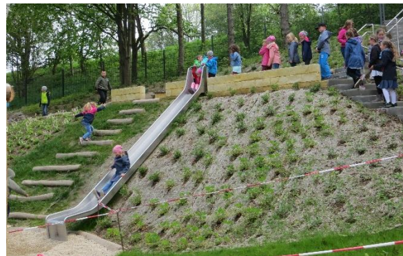
Die Grundschulkinder erkunden erstmalig die neue Freizeitanlage

aufweist. Mit Rutsche und Kletterfelsenstrecke ist der Hang nun eine sportliche Herausforderung für alle kleinen Besucher.