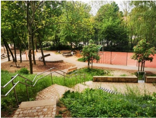
Grün eingebettete Freizeitanlage

Naturerlebnisse und sichern den Hang mit entsprechenden Bodendeckern.