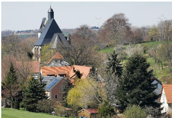
Ortsansicht Burkhardswalde mit Kirche

Burkhardswalde liegt im Seitental der Großen Triebisch. Das weithin sichtbare Kennzeichen des Ortes ist die spätgotische Hallenkirche.