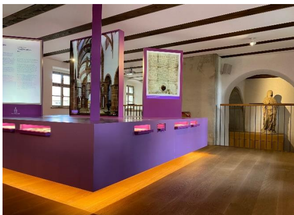
Im Besucherzentrum können sich die Gäste über die Geschichte und Bedeutung des Klosters informieren

Im Besucherzentrum erwartet die Gäste eine Klosterausstellung mit multimedialer Präsentation unter dem Titel „Wechselburg entdecken – Gott suchen, wo er nicht vermisst wird.“