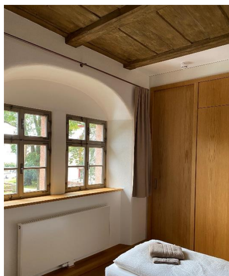
Ferienwohnung mit hochwertiger Ausstattung

Die Jury hob besonders hervor: „Ruhe verströmende, zum Teil barrierefreie Gästewohnungen zeigen sich in praktischen Grundrissen, hochwertigen Materialien und in höchster gestalterischer Qualität. Der neu konzipierte Klosterladen mit integrierter Ausstellung ermöglicht die Wahrnehmung der Besonderheit des Ortes. Entstanden ist eine dem Ort angemessene, hervorragende, bis ins Detail gehende sorgfältig durchdachte denkmalpflegerische und baugestalterische Lösung.“