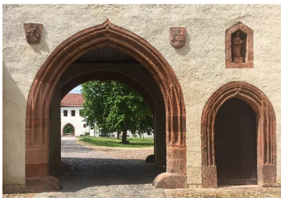
Das markante Tuffgestein gibt dem Torhaus des Klosters Wechselburg einen besonderen Charakter

Zu dem Kloster-Ensemble gehören die Stiftskirche, die Schlossanlage und ein 21 Hektar großer Schlosspark. Ein spätgotisches Torhaus ist der Hauptzugang zur Klosteranlage.