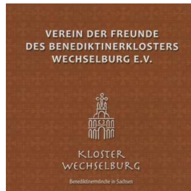
Logo des Vereins der Freunde des Benediktinerklosters Wechselburg e.V.

Dieses Äußere Torhaus stand jahrzehntlang leer. Der Verein der Freunde des Benediktinerklosters Wechselburg e. V. nahm sich des Torhauses an und begann nach dem Kauf des Denkmals, ein Nutzungs-, Sanierungs- und Finanzierungskonzept zu entwickeln.