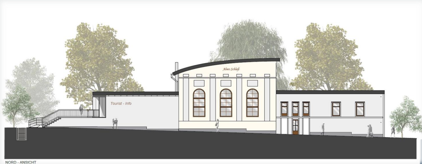
NORD - ANSICHT