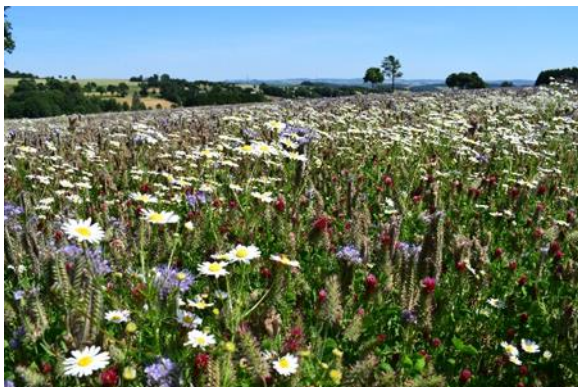
Artenreiche Blühwiese in der Zwönitztal-Greifensteinregion

Unterstützt durch ein LEADER-gefördertes Projektmanagement gab es zahlreiche Angebote und Maßnahmen zur Verbesserung der Habitatbedingungen von Wildbienen, Schmetterlingen und anderen blütensuchenden Insekten in der Region.