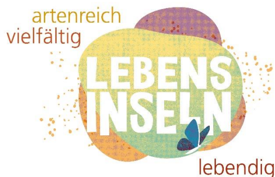
Logo der Aktion „Lebensinseln“

Speziell für die Zielgruppe der Geocacher entstanden in allen Kommunen thematische Geocaches, die zu einer digitalen Schnitzeljagd in die Natur einladen. Rätsel- und Infoblätter vermitteln viel Wissenswertes über Insekten und Insektenschutz. Ein Podcast ergänzt die Geocaches https://www.youtube.com/watch?v=HEpY8aqGp5I .