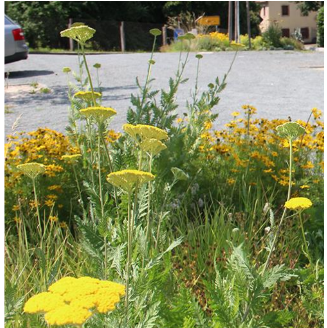
Abb. 6: Blühende Staudenpflanzungen im Juli