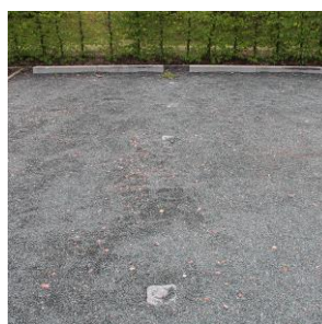
Abb. 4: Splittdecke Parkplatz