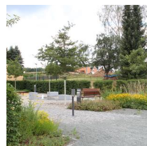
Abb. 5: Vom Parkplatz zur Aufenthaltsfläche mit Brunnenanlage