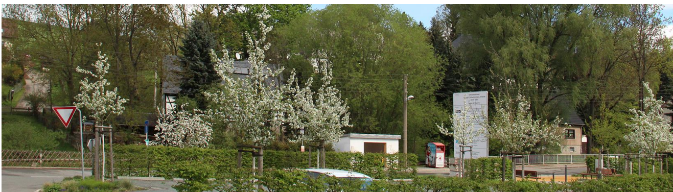
Abb. 1: Blühende Obstgehölze im Frühjahr