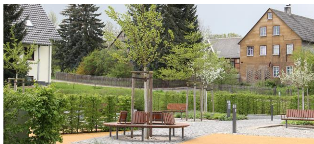
Abb. 3: Sitzgelegenheiten

Der Platz besteht aus einer Aufenthalts- und Spielfläche sowie einem Bereich mit Parkplätzen. Es wurden für die Nutzungen angemessene, differenzierte Bodenbeläge verwendet. Die Gehflächen sind mit Natursteinpflaster gestaltet, im Spielbereich kam ein Kunststoffbelag mit Fallschutzfunktion zum Einsatz. Die Stellflächen für PKW wurden nicht versiegelt, sondern versickerungsfähig als Splittdecke ausgebildet. Obstbäume beschatten den kleinen Platz. Pflanzflächen mit Gräsern und blühenden Stauden ziehen Insekten an und geben dem Platz ein angenehmes Erscheinungsbild.