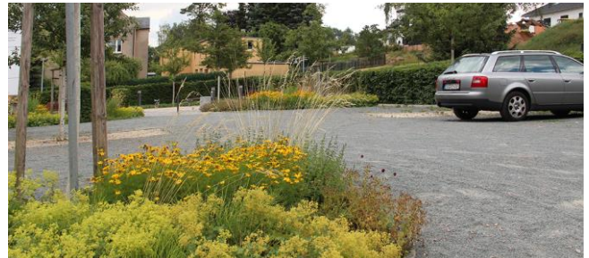
Abb. 7: Parkplatz